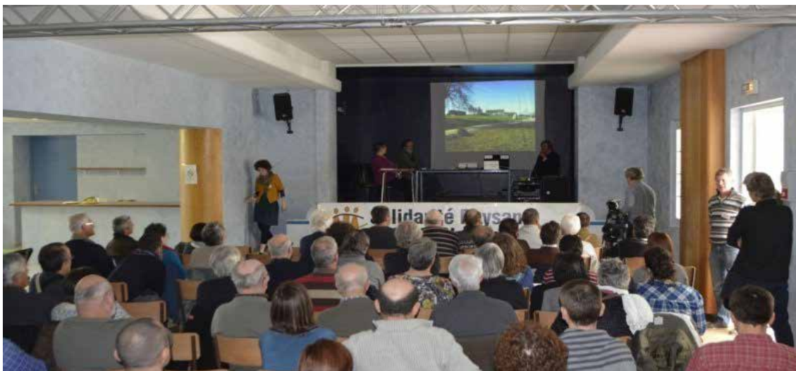
Une partie de l'assistance lors de la projection.

L'assemblée générale du mouvement de soutien des agriculteurs en difficulté s'est tenue à Migré, mardi. Une centaine de personnes sont venues écouter les témoignages des agriculteurs en situation de précarité. C'était également l'occasion pour les bénévoles de se rencontrer et d'échanger sur leurs dossiers en cours.